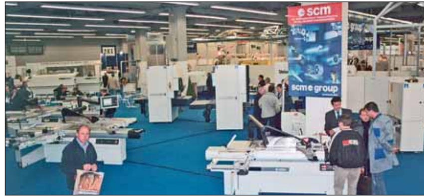
Dominują w Norymberdze maszyny dla zakładów rzemieślniczych

Organizatorzy spodziewają się rozwoju branży drzewnej i budowlanej w Niemczech, w związku z nową polityką gospodarczą wybranego jesienią niemieckiego rządu. (bej)