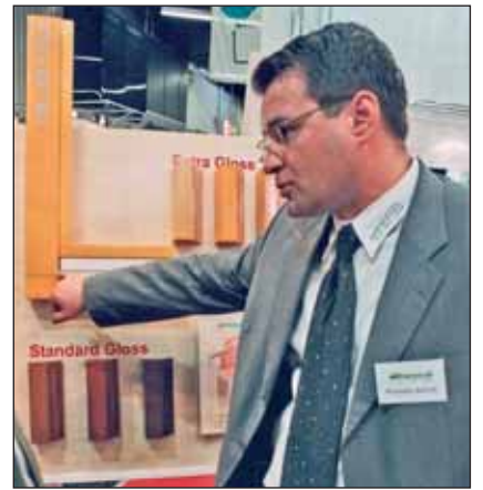
Na stoiskach zachodnich firm, np. Rhe-nocoli można spotkać polskich przedstawicieli

Do udziału w targach zgłosiło się 11 polskich firm. Ale polscy wystawcy pojawiają się głównie na targach Fensterbau/frontale, ponieważ wielu producentów okien przekonało się o dużej randze