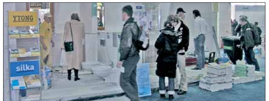
Na oczach odwiedzających ubiegłoroczne targi powstawała łazienka