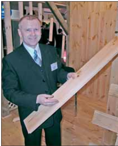
Nowość z Tartaku Olczyk - panele sosnowe gotowe do montażu